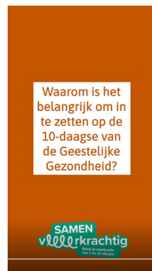
Afbeeldingen downloaden : ToolkitMaApr