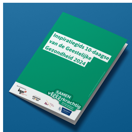
Afbeeldingen downloaden : ToolkitMaApr