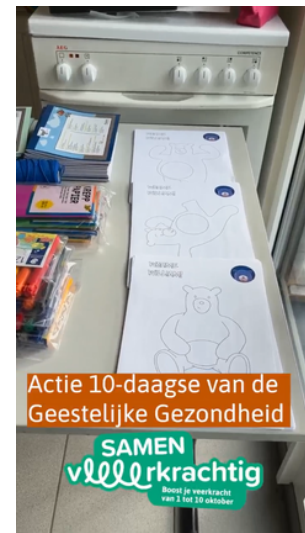
Afbeeldingen downloaden : ToolkitMeiJun