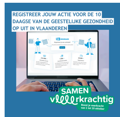
Afbeeldingen downloaden : ToolkitMeiJun