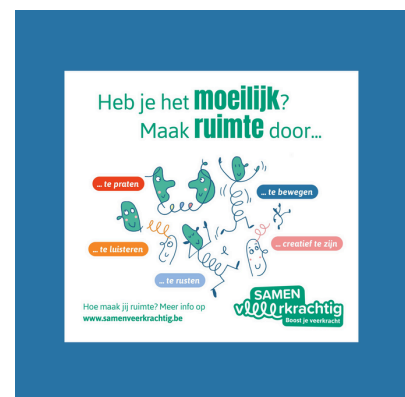
Afbeeldingen downloaden : ToolkitMeiJun