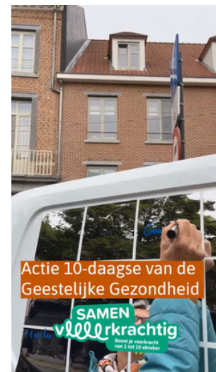
Afbeeldingen downloaden : ToolkitMeiJun